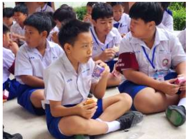
วันที่ ๒๑ สิงหาคม ๒๕๖๘