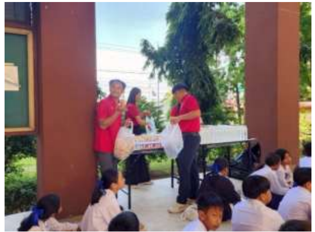
วันที่ ๑๔ สิงหาคม ๒๕๖๘